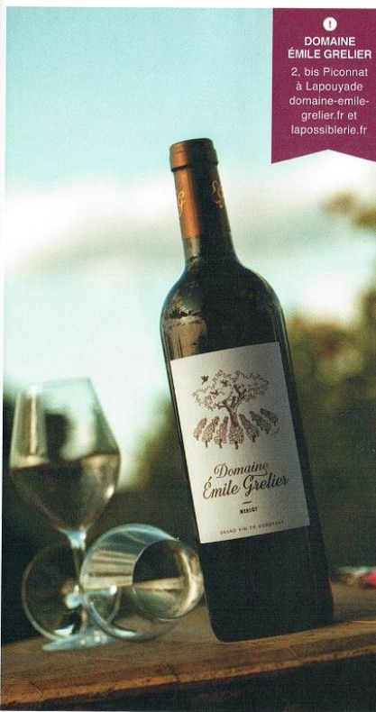
1 DOMAINE ÉMILE GRELIER 2, bis Piconnat à Lapouyade domaine-emile-grelier.fr et lapossiblerie.fr